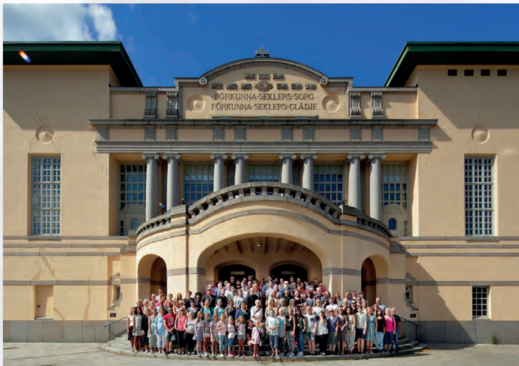
Östgötateaterns personal framför stora teatern i Norrköping.

Våra huvudmän är Norrköpings- och Linköpings kommun samt landstinget i Östergötland.